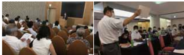
農場HACCP普及推進会議 及び意見交換会